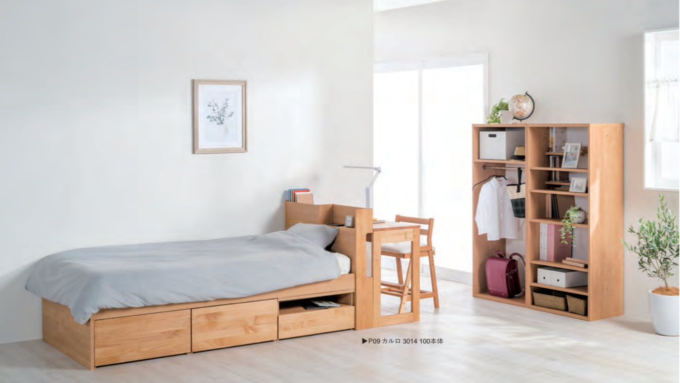
▶P09 カルロ 3014 100本体