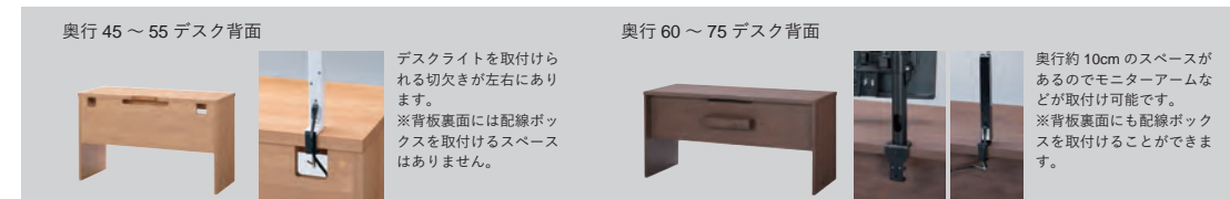
奥行45 ~ 55 デスク背面

※高さは1cm単位です。※オーダーデスクご注文時に併せてご注文下さい。ご注文後の高さ変更はお受けできません。※既定デスクの高さ変更はできません。※脚高さカットをした場合、高さによっては引出しやワゴンが干渉する場合があります。予めご了承ください。(H730で天板補強下寸法 H628mm)