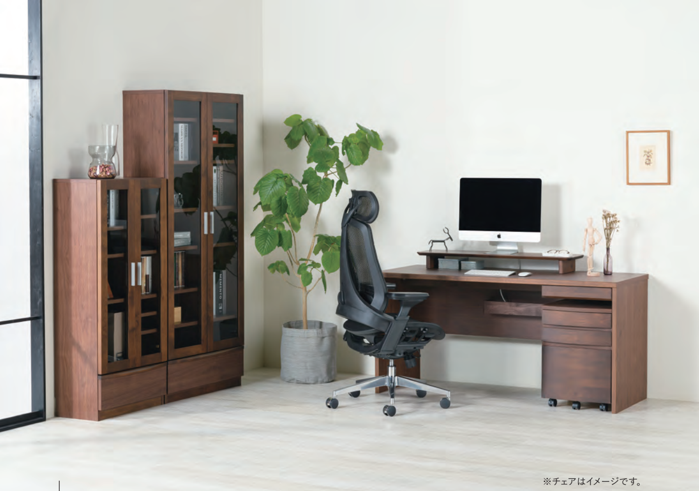
※チェアはイメージです。